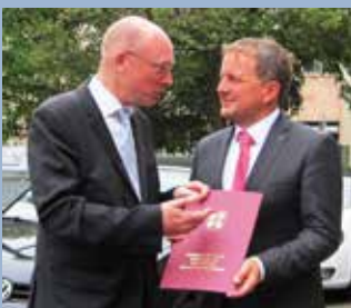
Minister Pegel (links) und OB Badenschier.

In Schwerin werden 86 weitere Straßenlaternen auf energiesparende LED-Technik umgerüstet und erneuert. Die Investition in Höhe von rund 600.000 Euro wird vom Land zur Hälfte gefördert. Den entsprechenden Fördermittelbescheid über insgesamt 300.000 Euro überreichte der Minister für Energie, Infrastruktur und Landesentwicklung Christian Pegel Mitte August an Schwerins