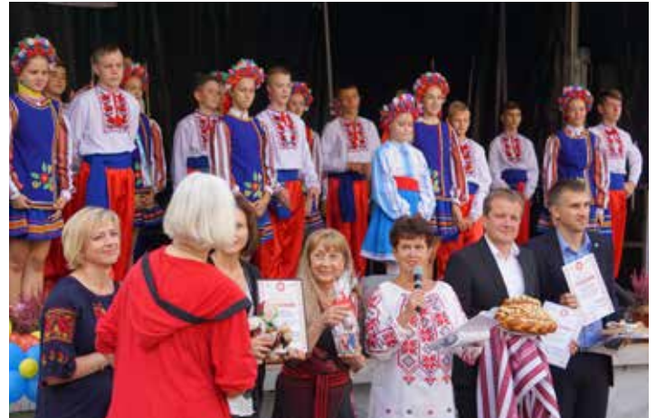
Auch ukrainische Musik steht wieder auf dem Programm der IKW.

In diesem Jahr wird der Preis bereits zum fünften Mal verliehen. Der Zeremonie schließt sich gegen 13.30 Uhr das traditionelle Festival der Kulturen an. Zum Programm gehören unter anderem musikalische Darbietungen unterschiedlicher Kulturen. Der Interreligiöse Dialog der Landeshauptstadt Schwerin wird einen Gesprächsteil gestalten. Für Schachfreunde ist ab 14.00 Uhr ein Simultanschachturnier