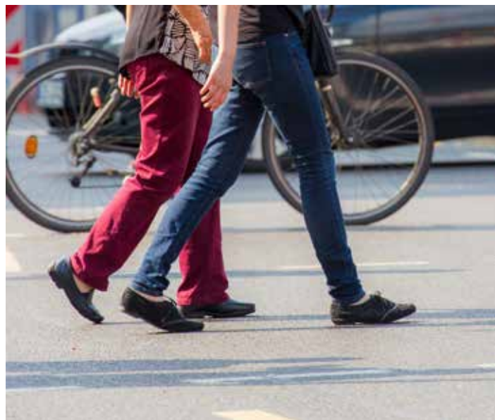
Steht im Mittelpunkt der Haushaltsbefragung der TU Dresden: die alltägliche Mobilität der Schwerinerinnen und Schweriner

Die Vorgaben der neuen EU-Datenschutzgrundverordnung werden selbstverständlich beachtet, kontrolliert und eingehalten. Die Teilnahme an der Befragung ist freiwillig. Sie kann telefonisch oder online erfolgen. Alle Haushalte der Stichprobe erhalten ein Ankündigungs-