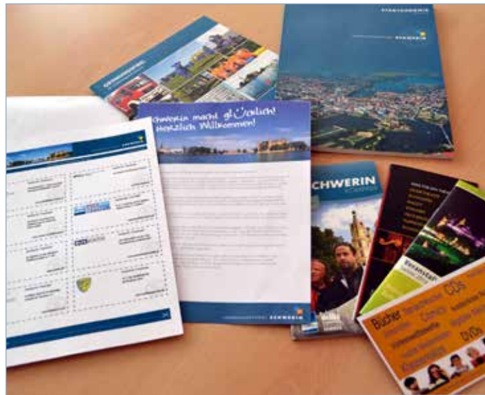
Das Willkommenspaket der Landeshauptstadt Schwerin.

Für die Gutscheine und Rabatte, die Schwerin-Neulinge mit attraktiven Angeboten der Stadt vertraut machen sollen, konnten auch private Partner gewonnen werden: So gewähren die Weiße Flotte und das Buskontor Preisnachlässe für ihre See- und Stadtrundfahrten, das Plantarium und das Freilichtmuseum in Mueß freien Eintritt, die Stadtbibliothek einen kostenlosen Leseausweis für einen Monat.