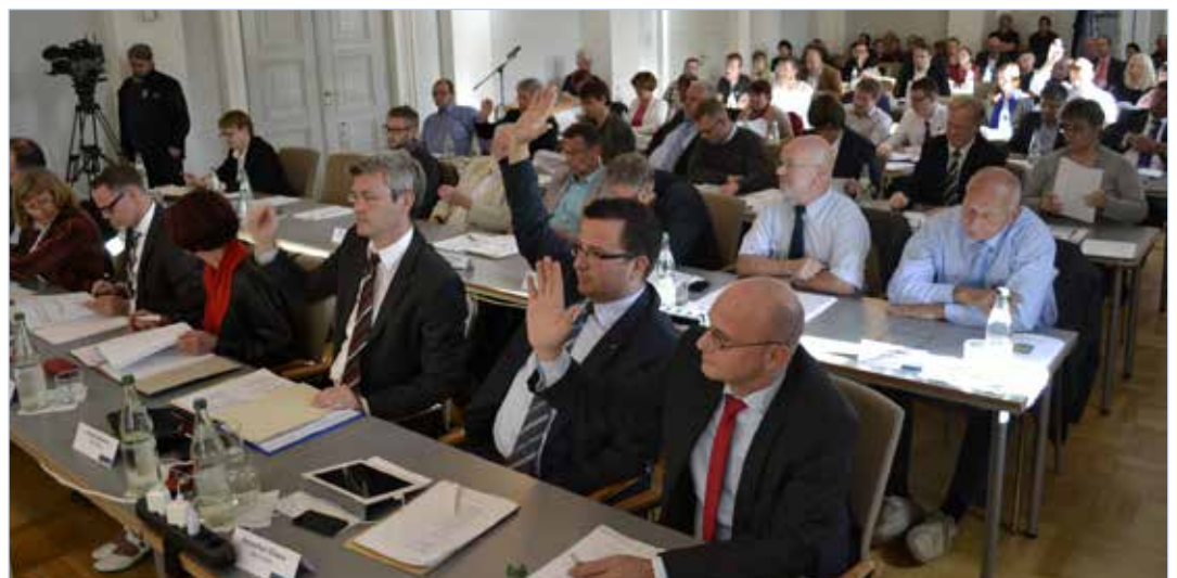
Die Stadtvertretung tagt einmal monatlich im Demmlersaal des Rathauses