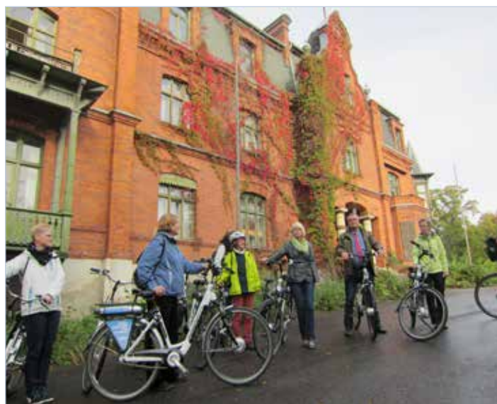
Attraktion auf der Gartenroute: Schlosspark Raben Steinfeld

Die erste Beteiligung der Landeshauptstadt Schwerin an einem Projekt innerhalb der Metropolregion Hamburg wurde damit erfolgreich abgeschlossen. Für die komplette Beschilderung der Fahrradwegestrecke wurden 160 Hauptwegweiser, 132 Zwischenwegweiser, 613 Einschubschilder, 65 Pfosten und 12 Tabellenwegweiser angebracht. Entlang der Strecke ist es nun für Einheimische und Touristen problemlos möglich, mit dem Fahrrad von Schlossgarten zu Schlossgarten zu radeln.